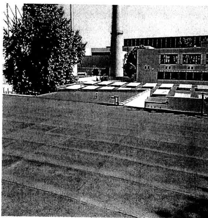
Покрив на сграда Дирекция "Развитие и модернизации"

Общ изглед (реална снимка) на сграда Дирекция "Развитие и модернизации"