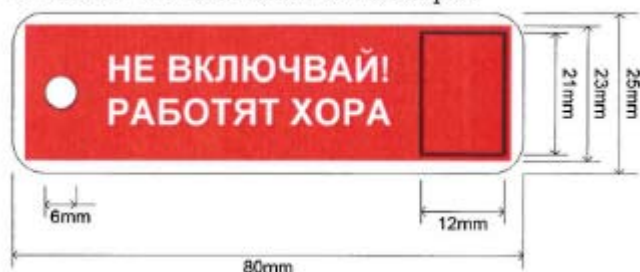
1. Табелка "Не включвай! Работят хора".