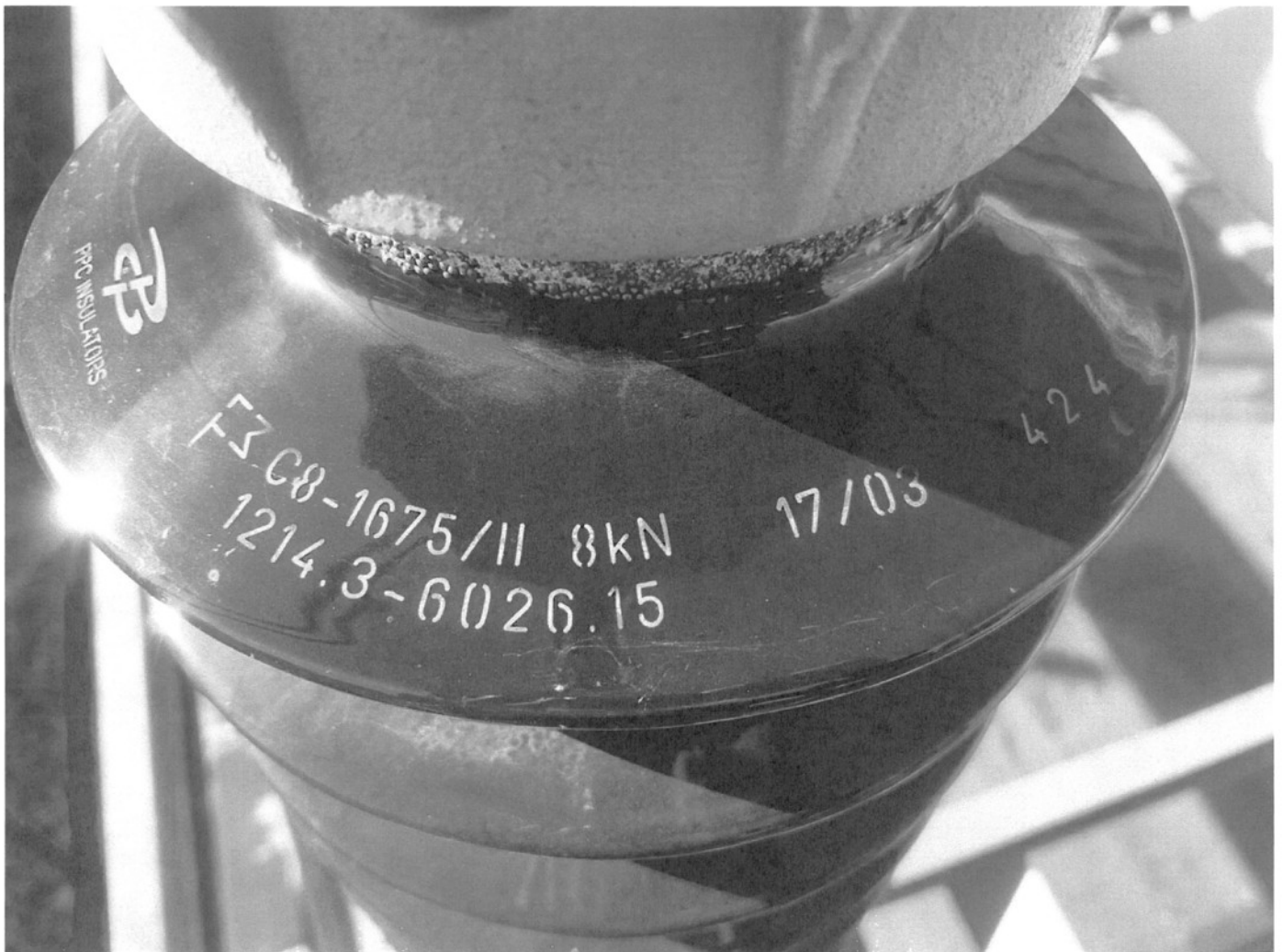
Фиг.1 Маркировка на опорния изолатор