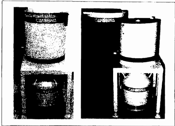
The 747E is 10 cm (4 in.) shorter* than the 747 and does not have a door lift mechanism.

The 1 mm (0.040 in.) tin and 1.6 mm (0.062 in.) copper graded liner prevents interference by lead x rays. The exterior is attractively finished with light grey textured paint, the interior is coated with clear polyurethane to prevent oxidation and facilitate cleaning. The floor of the shield has a 11.4 cm (4.5 in.) diameter hole which will accommodate either flanged or slimline cryostats. Four-inch long, clamp-on cold finger extensions are available for most cryostats. Preamp hardware Option PHW (for Canberra Preamp) is also required to ensure that flanged cryostats fit within the 28 cm (11 in.) shield diameter. Adjustable foot pads provide a convenient means for leveling. Optional annular lead plugs are available to minimize the streaming path through the hole in the shield floor. A detector lift and taller table are available to accommodate installation of other cryostat types, such as, the MAC's and 7500SL-RDC. See option list below for details.