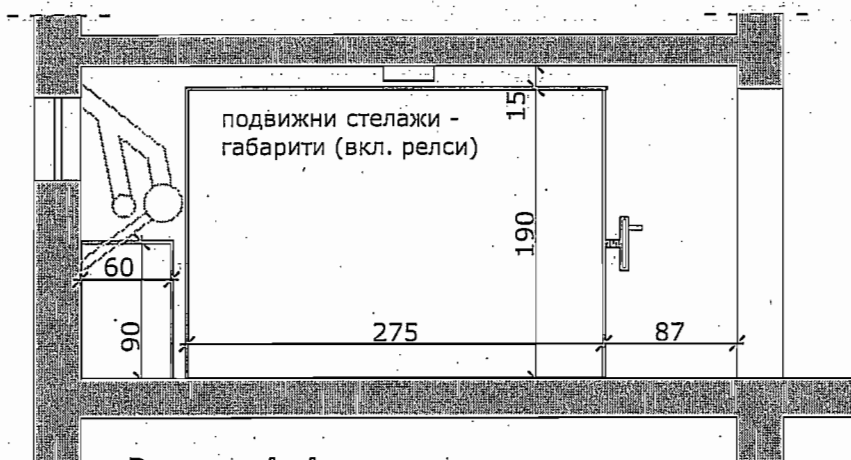
Разрез А-А на технически архив № С 02